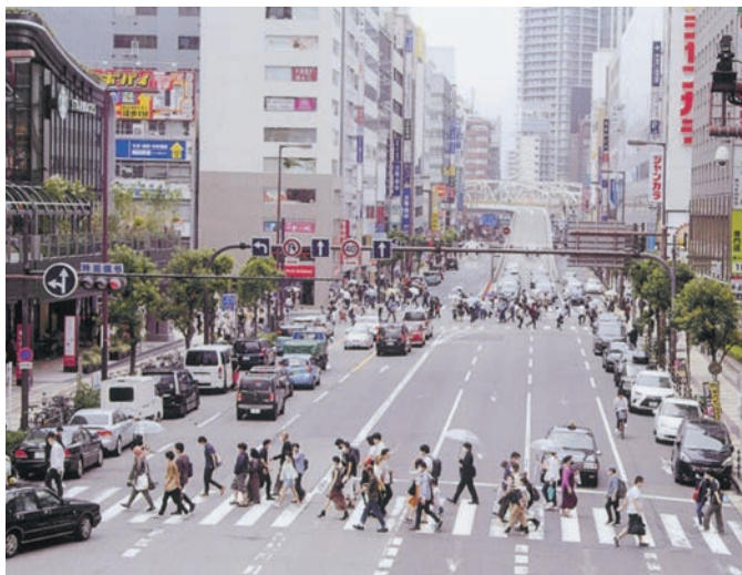
今、大阪駅と阪急電車をつなぐ橋上から北の十三方面を見ると、人の流れは以前のように戻ってきた感じがする