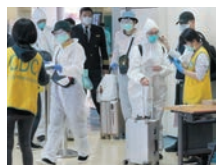
乗客は完全防護姿で搭乗手続をする

に政府は全てのマスク生産工場及び原材料工場の生産能力を増やすことを提唱し、一ヵ月以内に日産2000万枚を達成しました。マスクの提供は国家配給制度で行って買い占めを避け、優先的に医療従事者に提供します。当初、自分の健康カードで指定の薬屋