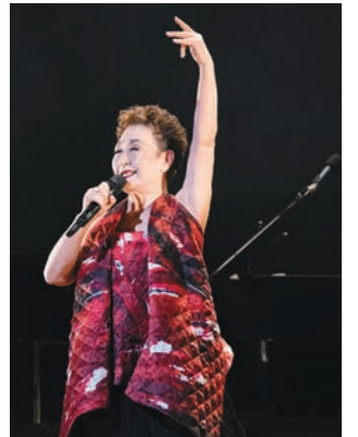
「日本に歌が戻ってきた」withコロナ時代のコンサート

プロオーケストラ奏者 3000人へのPCR検査を文化省が保障 今瀬さんは、日本の音楽界のためにとても素敵な行動をしました。なんと元バレリーナで文科副大臣の浮島とも子衆議会議員へ今瀬さんが相談にいき、たった3日で、日本のプロオーケストラ奏者全員へのPCR検査を行うための予算を文化省から引き出したのです！ ウィーンフィルハーモニーオーケストラでは既に団員全員にPCR検査を実施、舞台上は陰性者のみという状況を作り、すでにソーシャルディスタンスなしで演奏会を開始しています。落ち着くまで、客席は間隔を開けながらだとしても、PCR検査をして、演奏者が陰性と分かれば、舞台は以前のように演奏できるし、疑心暗鬼ではなく安心して演奏に集中できます。演劇界でも、お笑いでもアイドルコンサートでも、マス