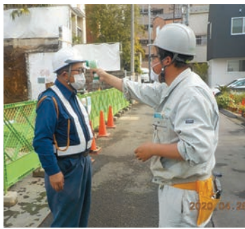
建築現場での非接触体温検査

大和ハウス工業、大林組、東急、戸田、西松、前田建設、など大手ゼネコン、ハウスメーカーは感染者の発生もあり、緊急事態宣言後一斉に1000か所以上の現場を工事中にしました。現場では3密が始まり、大手ゼネコンの西新宿Sビル現場では「朝礼に1000人が集まりコロナ感染で怖くて仕事ができない」との訴えがあり、東京土