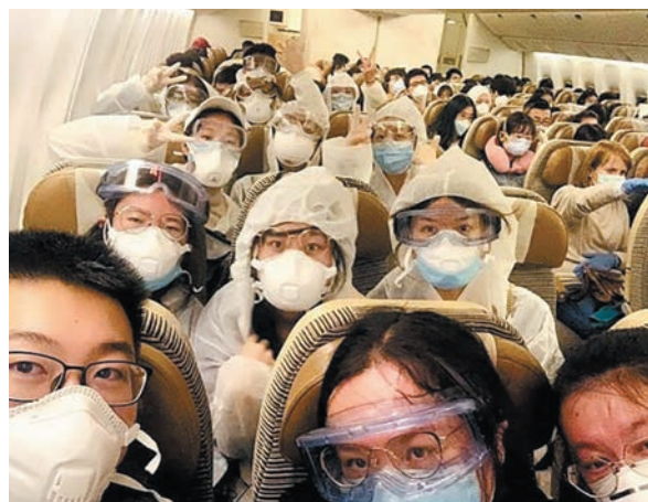
防護服姿で飛行機に乗る人々

関、場所、ビルでは必ず体温検測し、マスクを着用させました。疫病の当初は台湾もマスクが不足、メーカーは大幅に値上げしマスクが手に入りませんでした。政府はマスク工場が生産した全部を買って、市場での売買を禁止し輸出を停止しました。同時