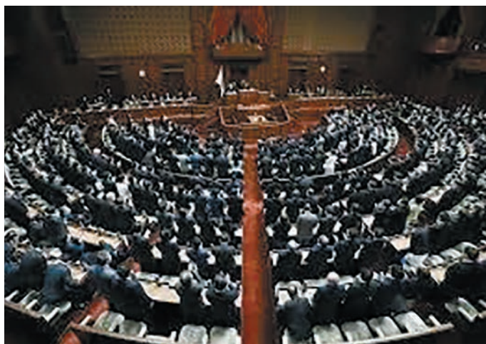
3分の2はどのラインか？

織は、他国領での戦闘や戦争に加わってはならない。国連の平和維持活動への参加は各議院の総議席の3分の2以上の賛成を経て法律に基づいて行う。その組織は、国内の災