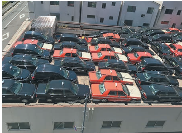
会社の屋上にぎっしり並べられたタクシー、客がないから流しは3ヵ月以上中止

る。現代の医療技術に置き換えると、かつてのローマ帝国の滅亡にもつながったといわれる黒死病(ペスト)にも匹敵するという学者もいる。この新型コロナウイルスが世界中に及ぼす経済的な影響はわが国の産業にも大きな影響を及ぼした。国は蔓延を予防するためにあらゆる生産活動の自粛を要求した。