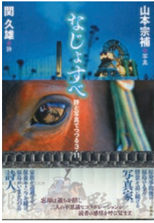
写真詩集「なじよすべ」