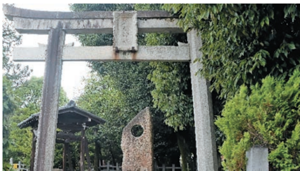
大酒神社 (京都太秦)

司馬遼太郎は、1923年8月に大阪で生まれ、1996年の2月に大阪で亡くなった上方を愛し続けた作家であった。大陸と日本との繋がりを思索し、歴史の表裏で生き続けた人々を、巧みに取材して小説に蘇らせた。1960年に、第42回直木賞を『梟の城』で受賞するが、産経新