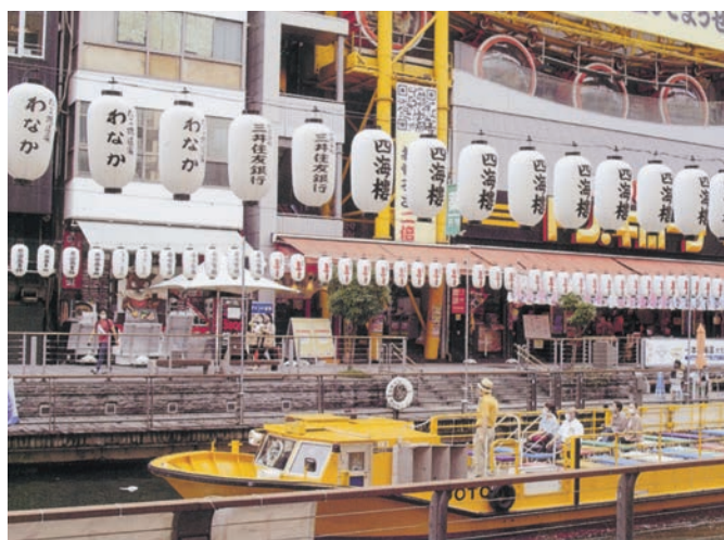
今、トンボリ川の人影は少なく、遊覧船の乗客もちらほら。船長は、こちらへ手を振ったが、寂しい