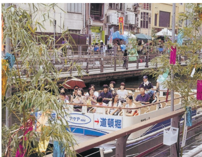
コロナ流行の前年7月7日は、遊覧船も元氣。乗客の笑顔も絶えなかった

閑古鳥鳴くトンボリ(道頓堀)店主は「さっぱりあきまへんわ」と泣く。いつもの「もうかりまへん」ではなかった。悲惨。