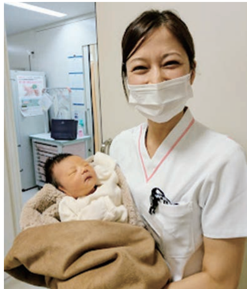
助産師として入院中の赤ちゃんを抱っこ

しずつ応援の声が届くようになっていった。「選挙カーを使わないでくれてありがとうございます」「チラシ読んだよ」「私もがんばるの」「あなたのこともっとたくさんの方に知ってもらいたいから、もっと元気よくね、もっと大きな音でいいんじゃないの」「立憲、応援してるよ」「私も看護師(助産師)です」「今貴方の投票に行ってきたよ」本当に