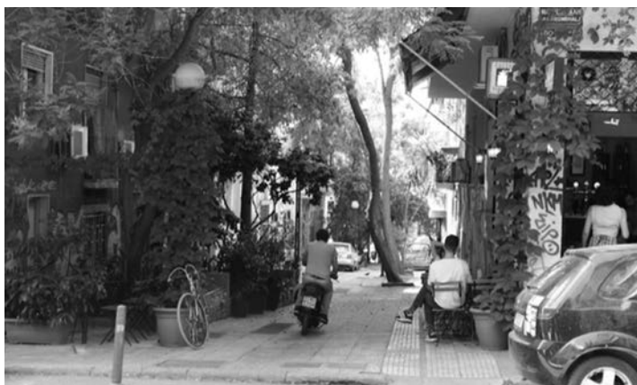
平成や令和とは縁遠い異国の街・アテネ （今年6月舞踏のワークショップ投宿先にて）

す。やがて東京オリンピック（1964）を境にモノと金を追求する高度経済成長の時代に入ったわけです。日本の公害もカドミウム公害を除き、ほぼこの頃から顕著になりました。よしんば高度経済成長を是としたとしても平成