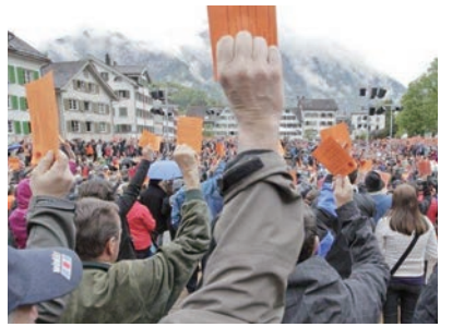
直接民主制の国民投票の様子 (グラールス州のラングマインデ)

合計31年間の海外生活で、ドイツやフランスに比べ、スイスは20年と一番長かった。スイスに滞在したのは、1976年から96年で、既に20年以上前の話で、移民、外国人労働者が増えた現在は、国民の対応も昔と変わってきているようだ。日本、西ドイツ、スイス、フランスの4カ国で、合計39年間のサラリーマン生活で所得税を支払った。税制を通して、その国の在り方、国民性が見えてきたのは、興味深く貴重な体験であった。