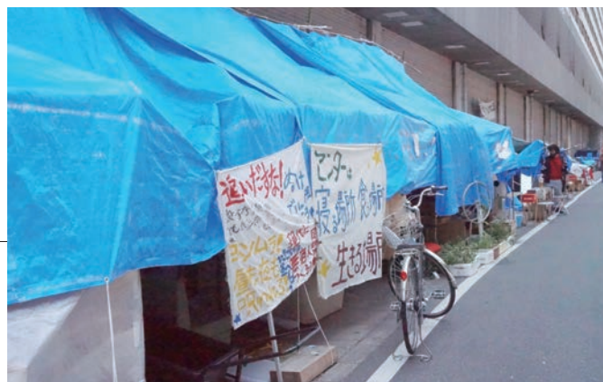
日本の高度成長を支えた日雇労働者が集まった「あいりんセンター」が閉じた。そこで抗議のテント