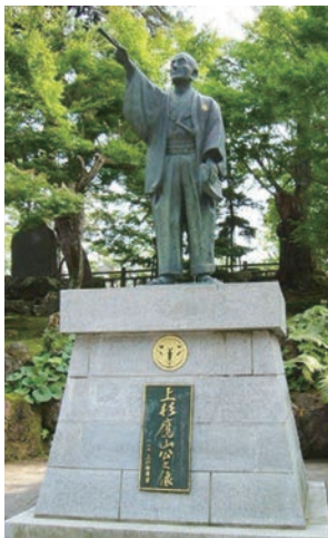
米沢市の上杉神社に立つ

所だ。この藩校はその後、幾多の人材を生み出す。米沢市の隣町、川西町(小松)にまで出かけて農民に字を教え学