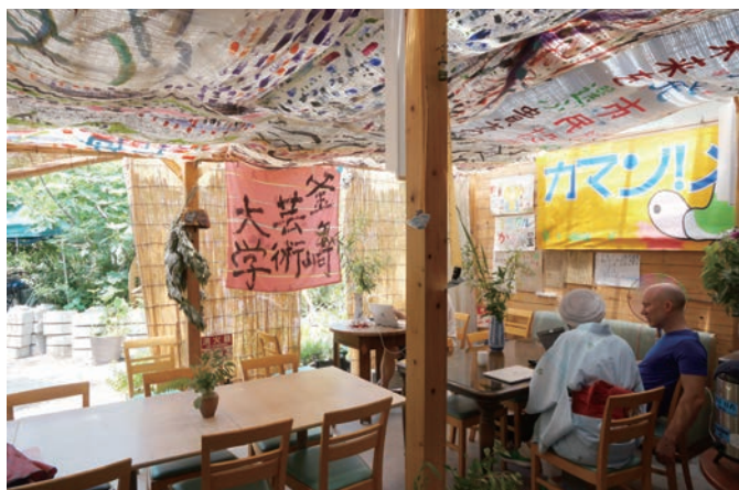
変貌する太子町あたりの商店街には「釜ヶ崎芸術大学」