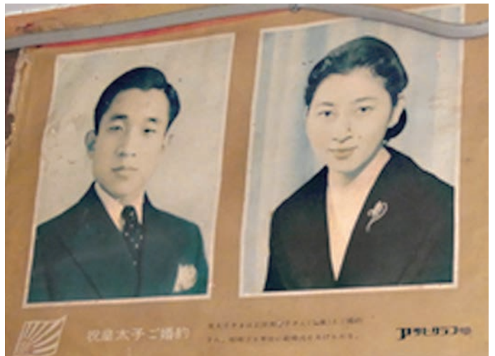
佐渡の古民家に飾られた皇太子ご婚約の切り抜き

江戸末期に欧米諸国が開国を迫り、薩摩藩と長州藩（のちの安倍首相の山口県）が徳川幕府を倒して近代国家を作り、暴力に依る革命を正当化する為に、天皇の権威を利用したのが明治維新で、天皇は権威と権力のトップに置かれ、立憲君主になったのです。伊藤博文が新国家で国民を統合する為に『万世一系の天皇』として利用し、大日本