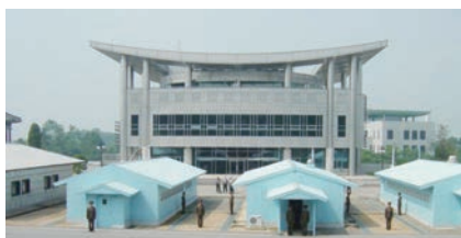
米朝会談 板門店 (北側を望む)

きでの文字が世界を踊らすので迷惑ですぞ。世界の指導者たる貴殿が世界中に直接発信するのは危険ですぞ。仲の良いシンゾーさんから『ツイッターは世界のリーダーには危険！』とアドバイスして差し上げましたらお聞き届けいただけますか？ 私が米国人なら貴殿に票を入れないぞ！ パリ環境協定から離脱しても孤立させない。シンゾーさんはTPPから離脱した貴殿を復帰に説得すると、二国間協議は行わないと日本国が言っていたはずがいつのまにか自動車関税に戦々恐々とさせられている。エルサレムをイスラ エルの首都と認めゴラン高原でのイスラエルの主権を認めてイスラムの敵意をあり、ゴラン高原をトランプ高原と名づけてもらいご満悦。いけませんよ