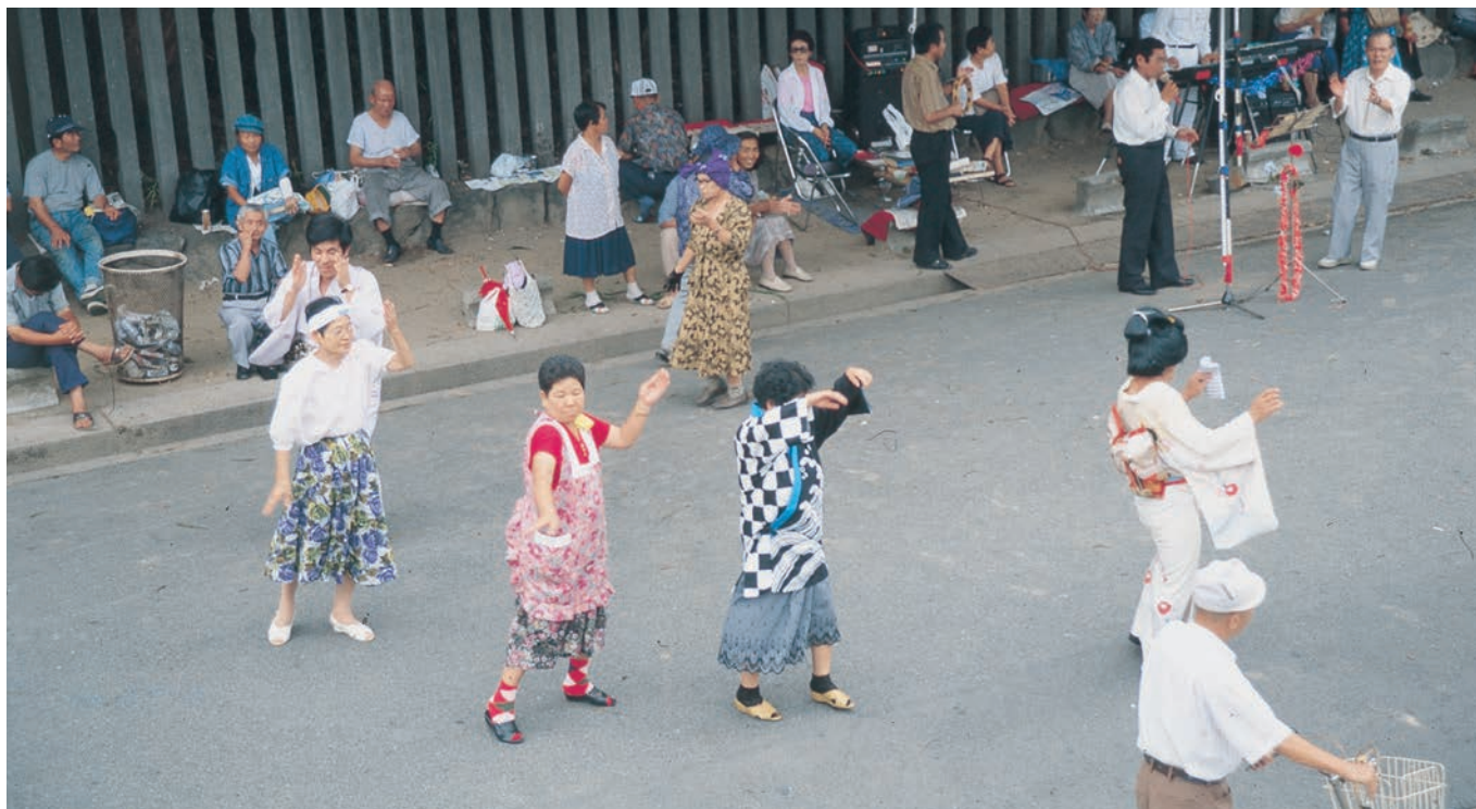
かつて天王寺公園付近は庶民の憩いの場だった