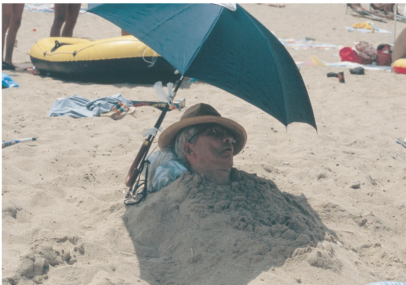
高齢者の海水浴は砂の中

URL : http://www.kawaraban.ne.jp/ E-mail : info@kawaraban.ne.jp