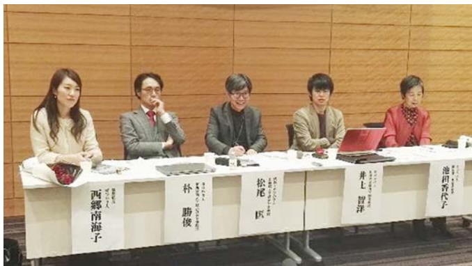
薔薇キャンペーン発足の記者会見

りおなじみになり、その差は年々広がっています。オクスファムの同じ報告によると、資産を10億ドル以上持っている大金持ちたちの総資産は、毎日25億ドルずつ増えているそうです。すから、当然です。