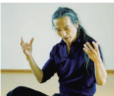
稽古中の筆者

バランスのとれた真に豊かな時代が再び来ることを祈っています。AI（人工頭脳）の時代がやってくるのだからそんな心配はご無用と言わなれ。AIの成果を最後に決定するのはやはり我々の「心とカラダのバランス」感覚なのです。