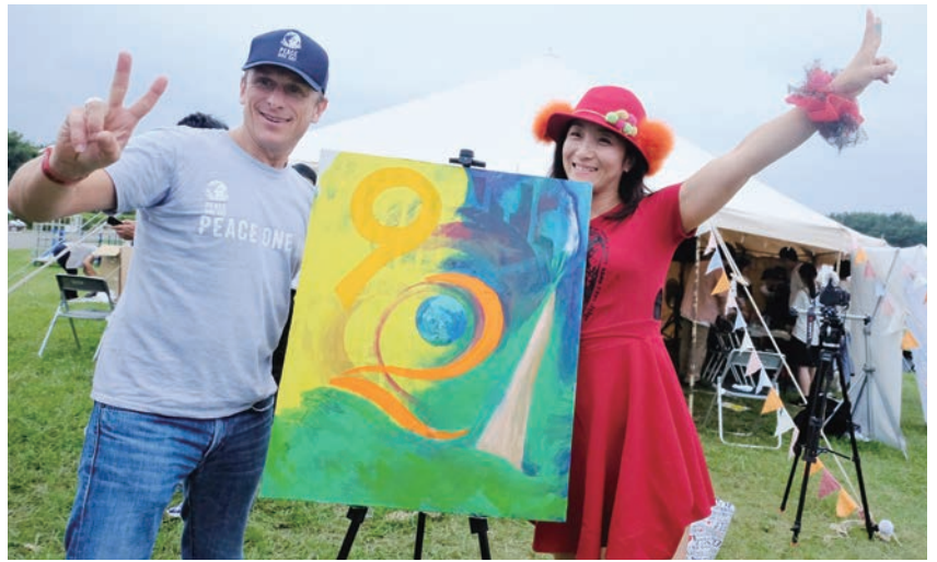
国際平和デー創設者でイギリス人映画監督のジェレミー・ギリ-氏と筆者と世界平和を願った絵

「バレンタインや母の日はあるのに、平和の日はないな」そう考えて国連公式の国際平和デーを実現した一人の映画監督がいる。イギリス人映画監督のジェレミー・ギリ-氏だ。「世界中の暴力をなくす1日を作りたい」そんな思いで紛争地取材したり、国連に働きかけたりして実現してしまふ、とんでもない行動力を持った人だ。実際に、