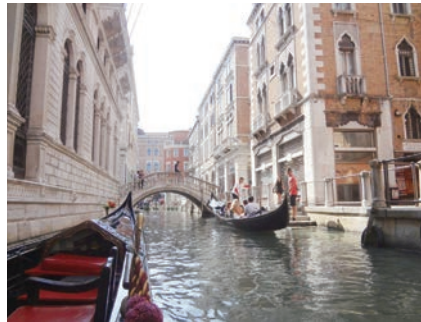
街中がこんな感じ、ゴンドラと石の橋

わしていく。彼らはお揃いの横じまのマドロスシャツのアンちゃんだ。そういえばカンツォーネのサービスはどこでも聞けなかったな。運河の橋は全て石の階段で1〜2m上がり降りしてアーチ状になっているからゴンドラは楽にく