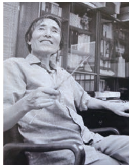
藤沢周平(『歴史読本』より)

人に天職というものがあれば、留治にとって教師が天職であり、周平にとっては、小説家が天職だった。留治が教師となつて3年目の春の24歳の時、定期検査で結核が発見され、休職を余儀なくされ、6年間の闘病生活後、30歳で退院した時には、教師への復帰は閉ざされていた。教師を続けられていれば、多くの子供達と接し、生徒に好かれる先生としての一生を貫いてい