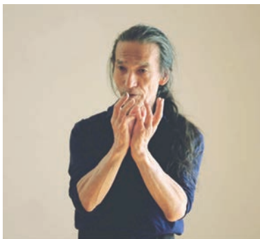
2016年、伊・ポローニャ山中コルメ 口で筆者。

今年3月初旬、ノルマン ディ冬合宿中のある日のこ と、突然舞踏合宿をこの夏を 最後に終了しようと思った。 既に数年前から考えていたこ とだったが、決めたのはその