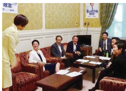
10月10日立憲民主党の会派に入る。枝野、蓮舫、辻元、福山議員達に笑顔で迎えられる

有地が有利な条件で売却されました。首相に近い人物が特別扱いを受けたのではないかとこの疑惑に加え、公文書を改ざんしてまでその事実を隠蔽した官僚。行政に首相への