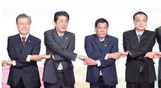
手をつなぐが仲良くなれるんかい？

6年も総理をしていたら各国の首脳とも絆もできようが、外交の安倍を強調するほど成果はないぞ。ロシアに経済援助をする割には「平和条約を」と言われ何の見返りもない。変人トランプとの蜜月を鼓舞するけどTPPや関税でもお返しがないどころか兵器を大量に買わせられる。お陰で軍事費は史上最高額だ。中国・韓国首脳とも良い関係も前進もない。ましてや