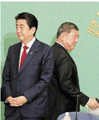
安倍は総裁選が盛り上がるのを避けて、石破は意気地なく公正・正直を避けた。自民党は総裁3選禁止の党則をやめた

安倍晋三首相は自民党の党則を変更させて3選を果たし憲法9条改憲に突き進もうとしている。安倍1強と言われて久しい。彼は数々の不人気法律を強引に成立させた。森友・加計疑惑も解明させないまま押し切った。それほど安倍政権は強いのか？平和憲法・9条も風前の灯だろうか？