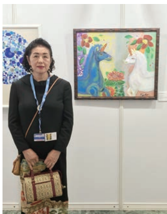
作品「固い絆」の前で

流しながら聞いてくださいました。日本でも平和の祈願をしていただければと思います」と語っています。