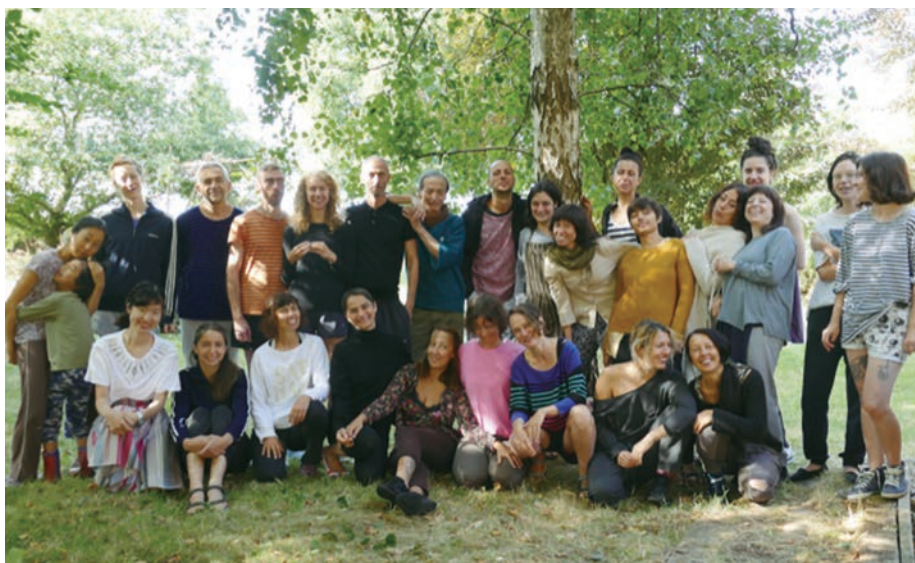
2018年8月、フランス南ノルマンディでの最後の舞踏合宿参加者と筆者

思えばこの30年間、弟子も 持たず（というかソモソモ ハ師弟Vなどという考え方が 好きではない）どんな組織に