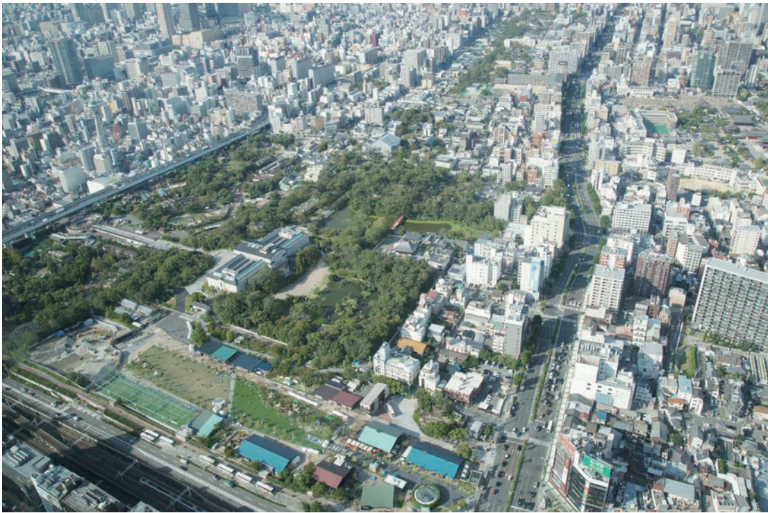
天王寺動物園を一望

最近しきりに思うことは大スターになぞらえられる王道人生のありかただ。大スターになる人は初め荒削りではあっても言うに言われぬ魅力