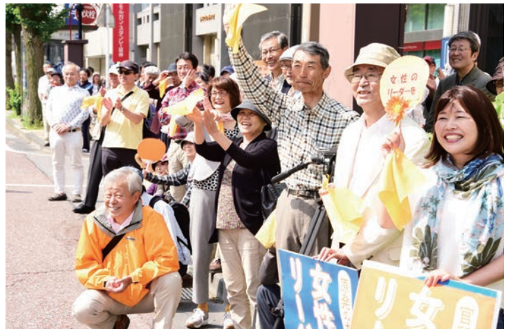
街頭から熱い声援が飛び

このとき、「安保法制に反対するママの会」や「学者の会」などが作られ、「シールズ」という若者たちの反対グループも結成されました。それらの動きの集大成として、「安保法制の廃止と立憲主義の回復を求める市民連合」（市民連合）が結成されました。この市民連合は、国会前デモを頻繁に行なう中で、次