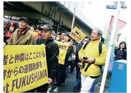
市内、府内、国内どこでもかけた

が、これは中学時代、駅伝部だったことの延長です。中学時代、南日本新聞を3年間配り続けた体験が新聞奨学生の選択にもつながりました。高校入試が始まる直前に顔見知りの陸上部教師から「今から練習しとけよ」と、陸上部に入るのが当然かのように言われたことに反発した私は陸上部には入らないまま。練習のきつさから逃れたい気持ちもなくはなかったのですが…。