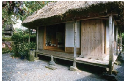
流刑地奄美大島の2度目の寓居、この住まいは3ヶ月で薩摩に召還された。西郷33歳、愛加那23歳、子供は2人。粗末な家です