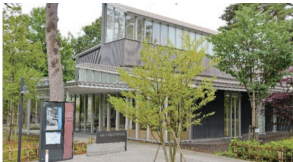
市立藤沢周平記念館(鶴岡市)

とつては行方不明の先生だったと、『再会』に記している。農家で成長、教師の経験、6年に亘る闘病生活、教師復帰への絶望、業界紙での記者、幼子を残して妻に先立たれた等の様々な経験が、順風満帆な生活から落ち毀れ行く人々や、社会の下層で精一杯生きる人々への、温かい視線となつて周平世界が築かれた。周平は、食肉加工の日本食品経済社に身を置いたが、10年に亘つて編集長として書き続けた『甘味辛味』では、